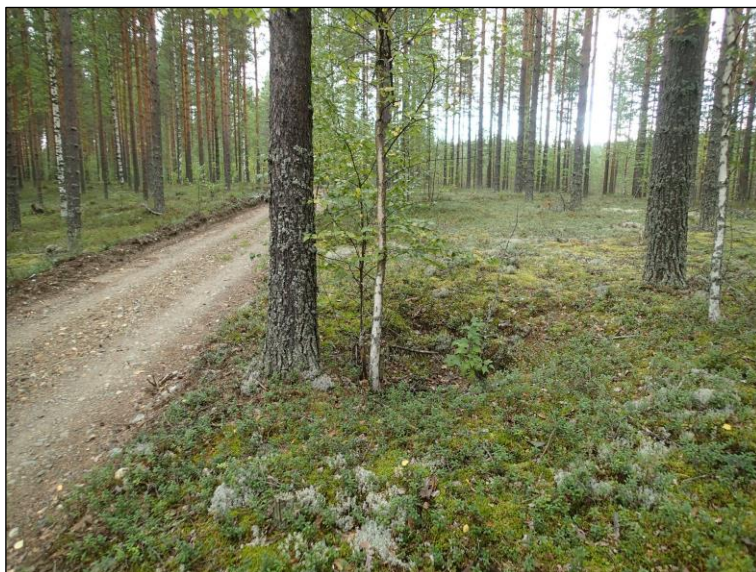
Metsäteiden varsilla on siellä täällä nykyajan maakuoppia .