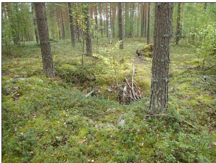
Kuoppa tien varrelle – siinä ei ole podsolia ja reunat jyrkät – nykyajan tuote.